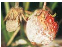
いちご灰色かび病