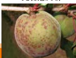
あんずかいよう病