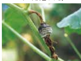
かぼちゃ灰色かび病