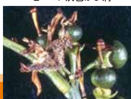
かんきつ灰色かび病