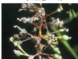
ぶどう灰色かび病