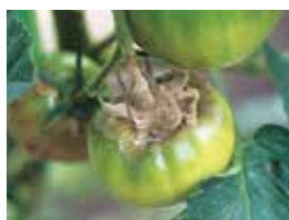
トマト灰色かび病