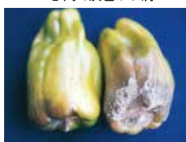
ピーマン灰色かび病