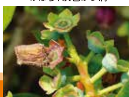
ブルーベリー灰色かび病