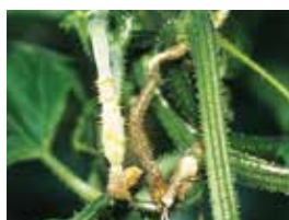
きゅうり灰色かび病